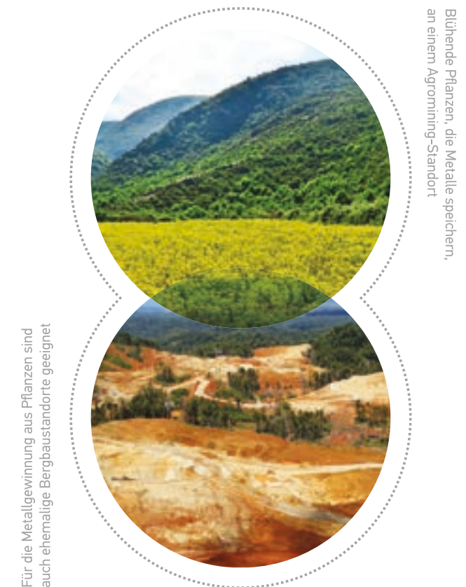
Blühende Pflanzen, die Metalle speichern, an einem Agromining-Standort

Cropping hyperaccumulator plants on nickel-rich soils and wastes for the green synthesis of pure nickel compounds